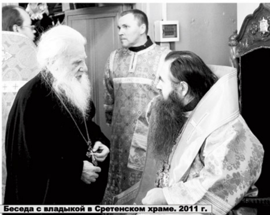
Беседа с владыкой в Сретенском храме. 2011 г.